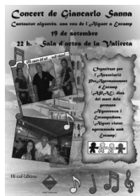
Concert alguerès a Encamp el 19 de setembre del 2013