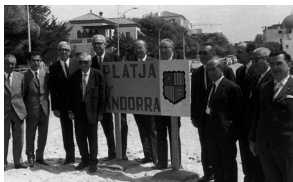
Síndics, Consellers Generals i membres del Sindicat d'Iniciativa a la platja d'Andorra de Salou el 1967.

A partir del 1965, i tenint en compte que les platges de la Costa Daurada són les més properes a Andorra, es va iniciar una relació amb diverses viles tarragonines. Una delegació andorrana formada per membres del Consell General i el Sindicat d'Iniciativa van acordar realitzar un Dia de Salou i un Dia d'Andorra per a celebrar la relació entre les dues viles. D'aquesta manera una platja a Salou es va anomenar platja d'Andorra, i unaavinguda a Andorra la Vella, es va anomenar