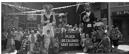
Expedició calongina a Sant Julià de Lòria a la plaça de Calonge-Sant Antoni laurediana amb els gegants de Calonge, Martí i Valentina