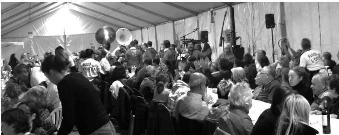
La banda d'Arès a la Festa de l'Ostra el 2019