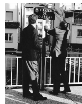
Inauguració del Passeig de Mojàcar a Encamp

de Rouillac a Encamp dona fe de l'agermanament. Per celebrar el 50è aniversari del primer acostament entre les dues viles el Cor de Rock d'Encamp, músics de Wiesentheid i associacions dansaires de Rouillac van actuar a Saint Pierre de Rouillac el 2017. Autoritats i encampadans van visitar a més el castell de Lignières i la destil·leria de conyac Martell, propietat de Pernod-Ricard, i altres llocs emblemàtics de Rouillac.