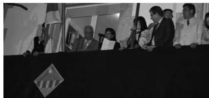
La Cònsol d'Andorra la Vella, Rosa Ferrer, llegint el pregó de la festa major al balcó de l'Ajuntament de Sant Pol de Mar, just després de la signatura del conveni d'agermanament el 23 de juliol del 2010