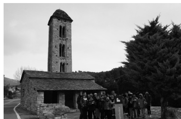
Els infants de l'Étang-Salé a Caldea i a Sant Miquel d'Engolasters.