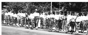
El jovenet escaldenc gaudint del viatge a l'illa.