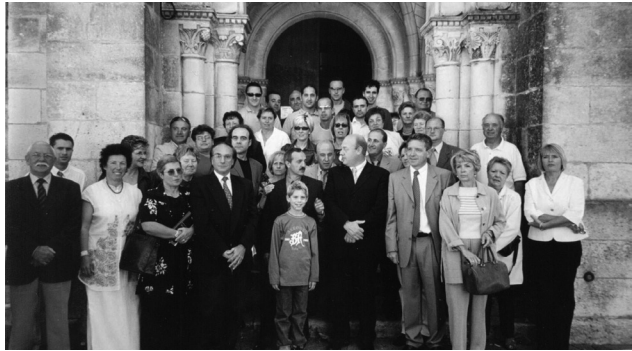
El grup de canillencs i autoritats en el viatge a Arès el 1994.