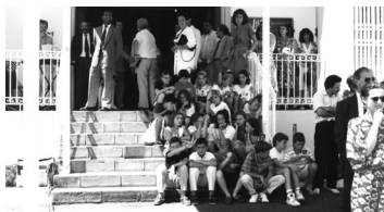
A la porta de la Mairie de l'Étang-Salé els joves andorrans i les autoritats en la signatura a l'illa de la Reunió el 3 de novembre del 1991.

El 2005, Escaldes-Engordany es va agermanar amb Lalín, una vila de la província de Pontevedra, a Galícia, a uns 50 km del mar. Des d'aleshores una vintena de persones grans i infants de les dues viles realitzen un intercanvi per descobrir l'entorn històric, geogràfic i cultural i reforçar lligams entre elles. A la Parròquia escaldenca resideixen un bon nombre de persones provinents d'aquesta vila gallega. La plaça de Lalín a Escaldes-Engordany fa palès l'agermanament, igual que al portal del Comú. Al portal del Consello de Lalín es ressenyen les activitats d'intercanvi i també detalls de la inauguració de la Rúa d'Escaldes-Engordany.