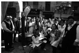
Els escudellaires d'Andorra la Vella a la plaça de l'Oli de Valls celebrant els 50 anys de l'agermanament el 27 de març de 2017.