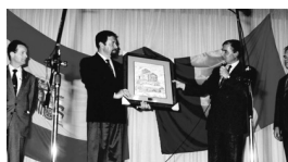
Liurament d'un quadre amb la imatge de l'església de les Bons a les autoritats de la vila germana per les festes del juny.