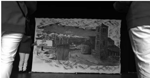
La pintura realitzada per un artista d'Arès durant el sopar de la Festa de l'Ostra el 2015 a Canillo