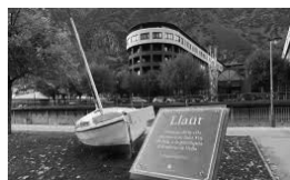
El llaüt, obsequi de Sant Pol de Mar a la ciutat germana, situat vora el riu Valira