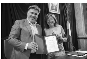
Albert Batet, Alcalde de Valls i Conxita Marsol, Cònsol d'Andorra la Vella refermen l'agermanament el 2 d'agost del 2017, 50 anys després.