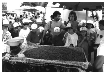
Els joves andorrans en un mercat a l'Étang-Salé.