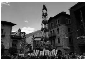
El castell 3 de 9 amb folre de la Colla Jove de Valls a la plaça Príncep Benlloch d'Andorra la Vella alçat en la festa major l'agost del 2019