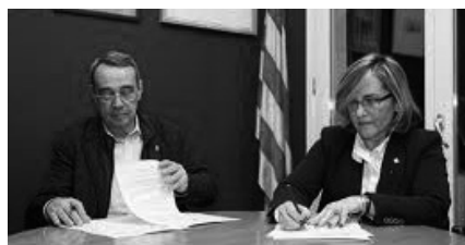
Jordi Minguillon, Cònsol Menor d'Andorra la Vella, signant un protocol complementari de cooperació amb l'Alcaldeessa de Sant Pol de Mar, Montserrat Garrido, per la Fira de Sant Pau el 25 de gener del 2015.