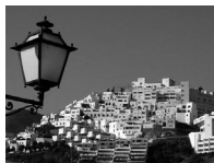
Mojàcar, l'Avenida de Encamp pujant a la part alta