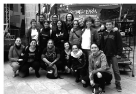
Actuació de l'Esbart Laurèdia a Calonge-Sant Antoni el 9 de novembre del 2015