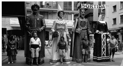
Els gegants de Sant Pol de Mar i d'Andorra la Vella a la festa major, a la plaça Guillemó